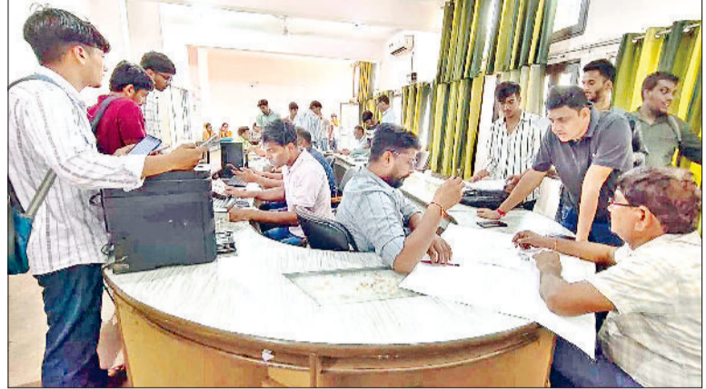
नारनौल। दाखिले के लिए कामजात जमा कराते विद्यार्थी।

आईटीआई में इस बार खाली सीटें रहना काफी चिंतनीय है। जबकि सरकार की तरफ से युवाओं के कौशल विकास को लेकर विशेष जोर दिया जा रहा है ताकि युवाओं रोजगार के अवसर उपलब्ध होने के साथ ही वह स्वरोजगार भी स्थापित कर सकें। अब पुनः पोर्टल खोलते हुए प्रचार-प्रसार की कमी आ रही है नजर आईटीआई में दाखिले के आकर्षण में प्रचार प्रसार की कमी और युवाओं में जागरूकता का अभाव देखा जा सकता है। अगर जिम्मेदारों की तरफ से समय रहते आसपास के विद्यालयों में कौशल विकास को लेकर जागरूकता शिविर या कार्यक्रम आयोजित किए जाते तो शायद इनमें सुधार संभव था, लेकिन इस बार काफी देर हो चुकी है। मुख्य ट्रेडों में विद्यार्थी दाखिला करा चुके हैं, वहीं बाकी ट्रेडों में दाखिला होना टैडी खीर लग रहा है।