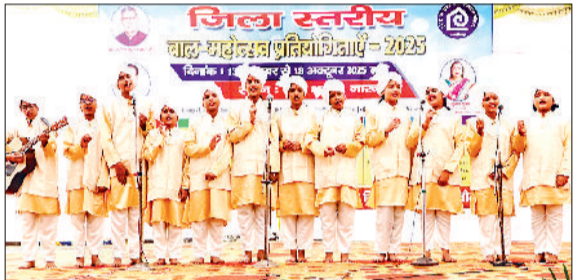
नारनौल। प्रतियोगिता में भाग लेते छात्र छात्राएं।

लिए इस प्रकार के सांस्कृतिक कार्यक्रमों में बढ़ चढ़कर भाग लेना चाहिए, जिससे एक स्वस्थ समाज की स्थापना हो। उन्होंने कहा कि नृत्य से शरीर तो स्वस्थ होता ही है, बौद्धिक विकास भी होता है। उन्होंने बताया कि आज की राष्ट्रीय समूहान द्वितीय, तृतीय व चतुर्थ गुपद्ध व क्लासिकल सोलो डांस