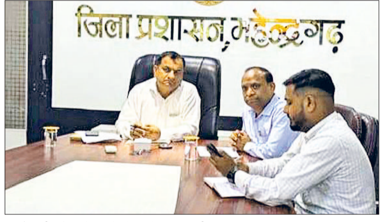
नारनौल। वीडियो कॉन्फ्रेंसिंग के दौरान मौजूद अधिकारी।