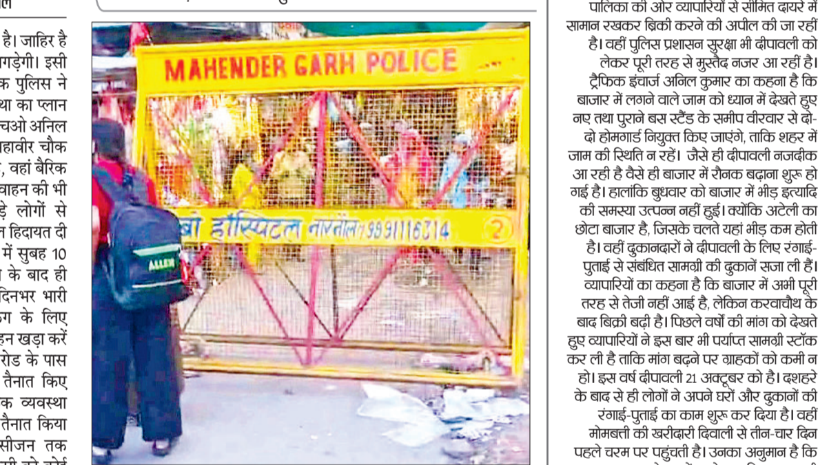
नारनौल। महावीर चौक से मुख्य बाजार मार्ग पर लगाया गया बैरिकेड।

पार्किंग के लिए पुरानी कचहरी मैदान है। वहां से वाहन खड़ा करें और बाजार में पैदल जाएं। किला रोड के पास भी बैरिकेड लगाकर पुलिस कर्मी तैनात किए जाएंगे। यहीं नहीं, जहां भी ट्रैफिक व्यवस्था बिगड़ती दिखी वहां पुलिस कर्मी तैनात किया जाएगा।