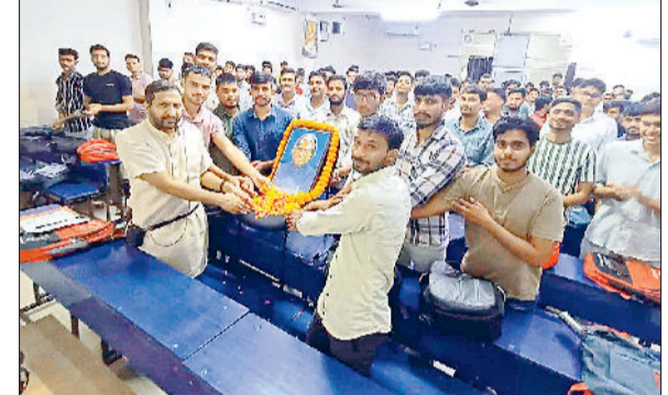
महेंद्रगढ़। अब्दुल कलाम के चित्र पर पुष्पापिठ करते हुए।