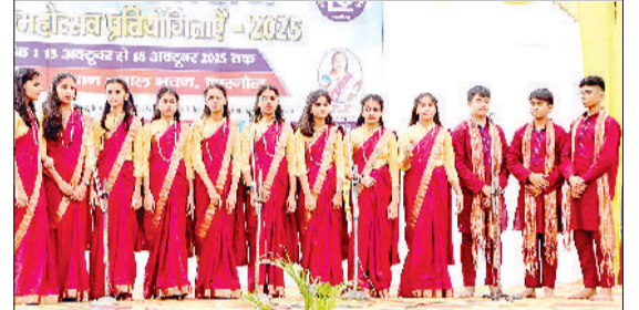
नारनौल। प्रतियोगिता में भाग लेते छात्र छात्राएं।