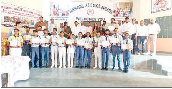
नारनौल। प्रतियोगिता के विजेता विद्यार्थी।

हरियाणा काउंसिल ऑफ साइंस इन्वेंशन एंड टेक्नोलॉजी के तत्वावधान में जिला शिक्षा अधिकारी कार्यालय की ओर से जिला स्तरीय विज्ञान प्रश्नोत्तरी प्रतियोगिता का आयोजन किया गया। जिसमें सीबीएसई से संबंधित विद्यालयों ने आरोही मॉडल स्कूल मंडाणा में भाग लिया। यह प्रतियोगिता दो गुप् में आयोजित की जाती है। जिसमें गुप ए में सीबीएसई से संबंधित विद्यालय भाग लेते हैं व गुप बी में हरियाणा विद्यालय शिक्षा बोर्ड से संबंधित विद्यालय भाग लेते हैं। हरियाणा विद्यालय शिक्षा बोर्ड से