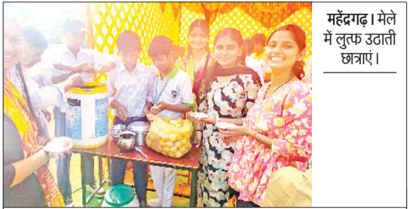
महेंद्रगढ़। मेले में लुफ उठाती छात्राएं।