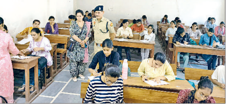
नारनौल। परीक्षा देते विद्यार्थी।